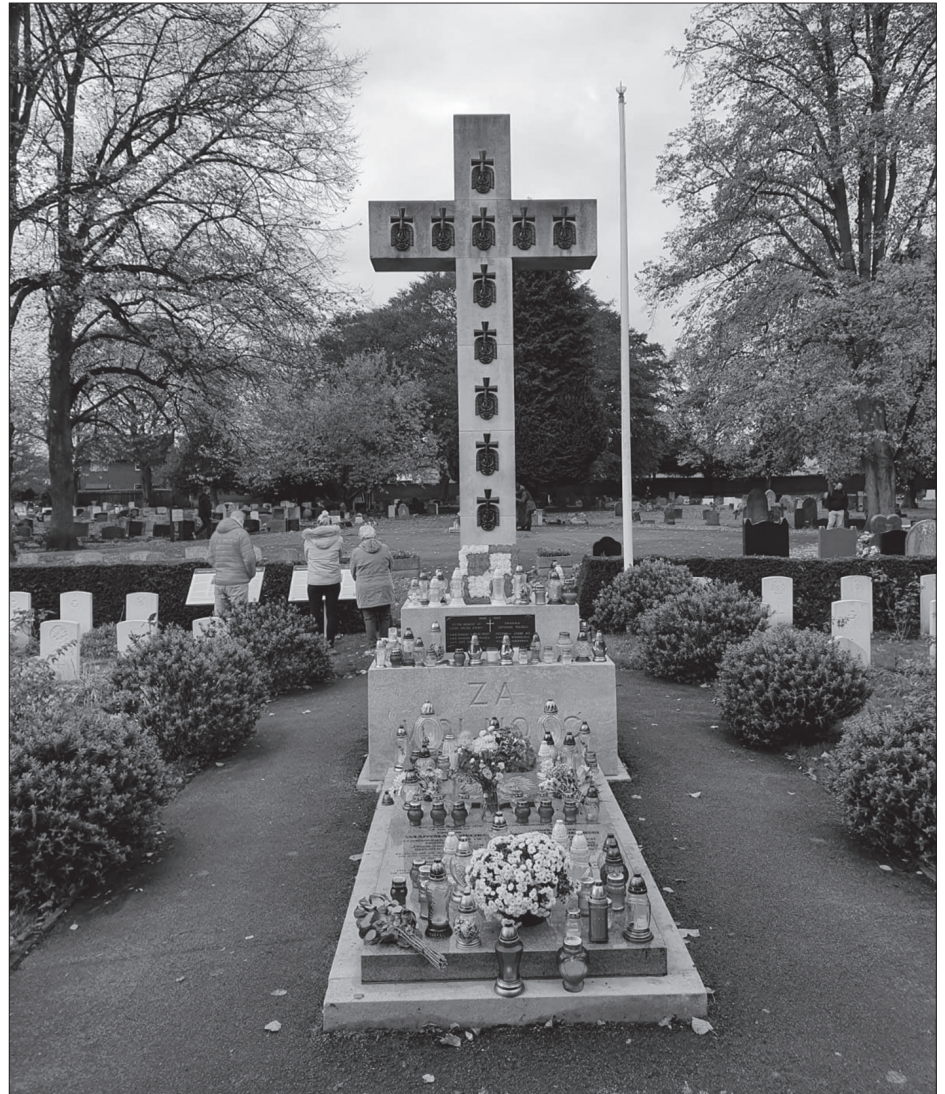
Krzyż z napisem „Za wolność” z angielskiego cmentarza w Newark-Upon-Trent w regionie East Midlands

Po blisko 50 latach oglądałam stare zdjęcia mojego Taty i, jak to bywa, nie wiedziałam, kogo przedstawiają. Z pomocą rodziny udało się zidentyfikować wiele osób, ale nadal nie wiedziałam, kim