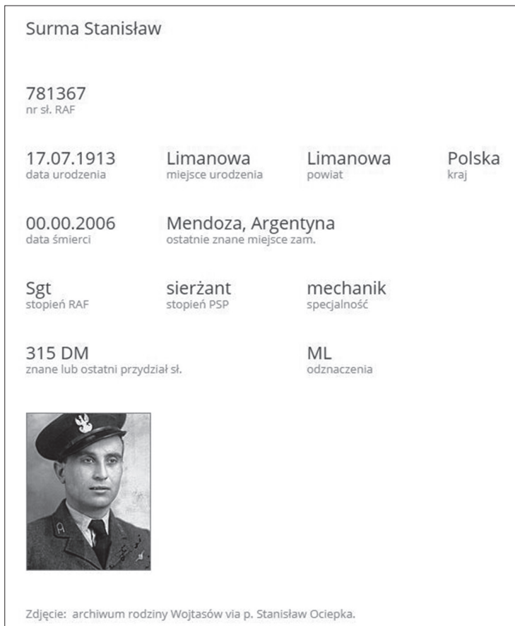
Zakładka Stanisława Surmy z Listy Krzystka, uzupełniona przez Piotra Hodyrę po nadesłaniu materiałów przez Halinę Kulig - 2020 rok