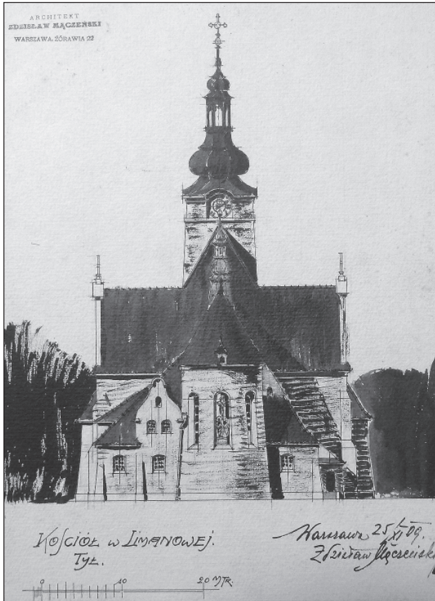
Rysunek projektowanego kościoła w Limanowej (widok od strony zachodniej - tył) datowany 25 listopada 1909 r..