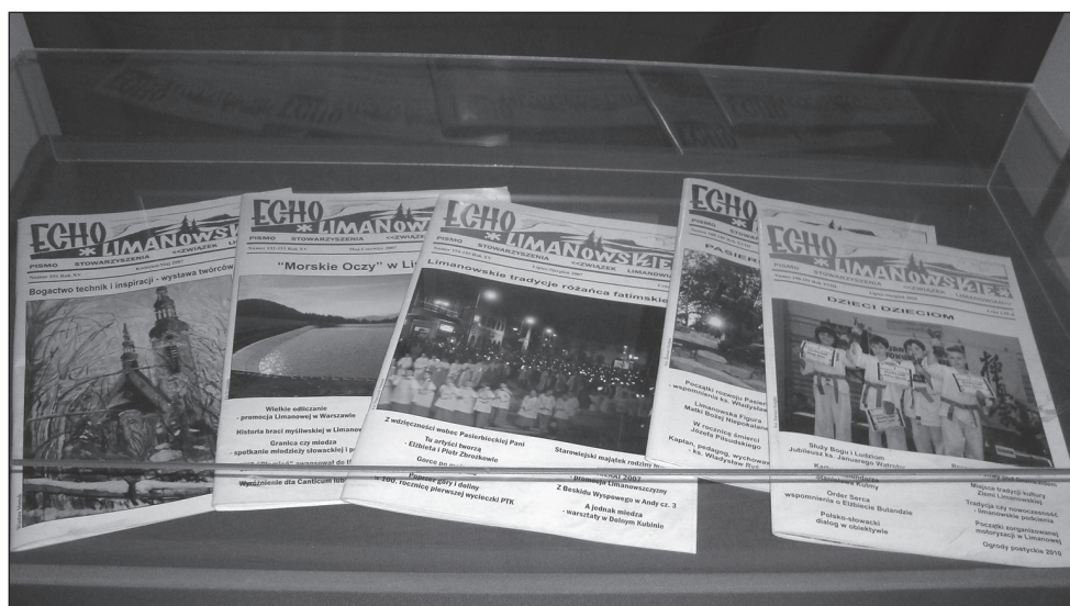
Ekspozycja pięciu egzemplarzy „Echa Limanowskiego” w Muzeum PW na wystawie „Kuba - Ameryka Łacińska - Polska”.