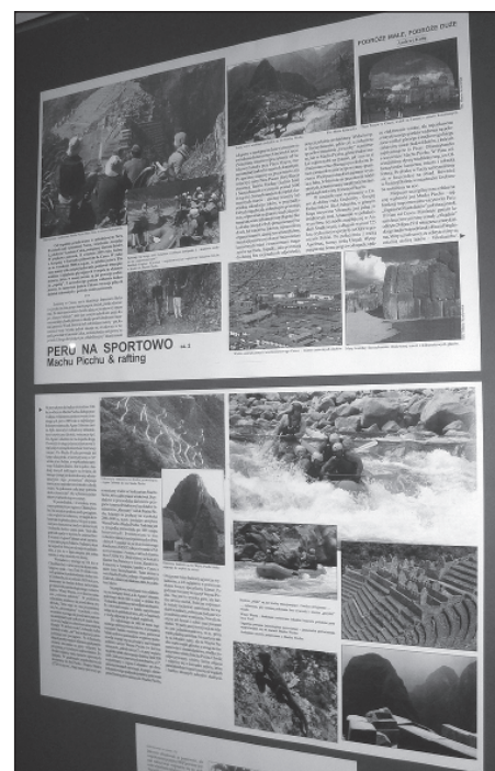
Ekspонат z wystawy „Kuba - Ameryka Łacińska - Polska”: fragment posteru z reportażem opublikowanym w „EL” 5 nt. wyprawy do Machu Picchu i raftingowych zmagani na rzece Apurimac (fot. A. Kulig).